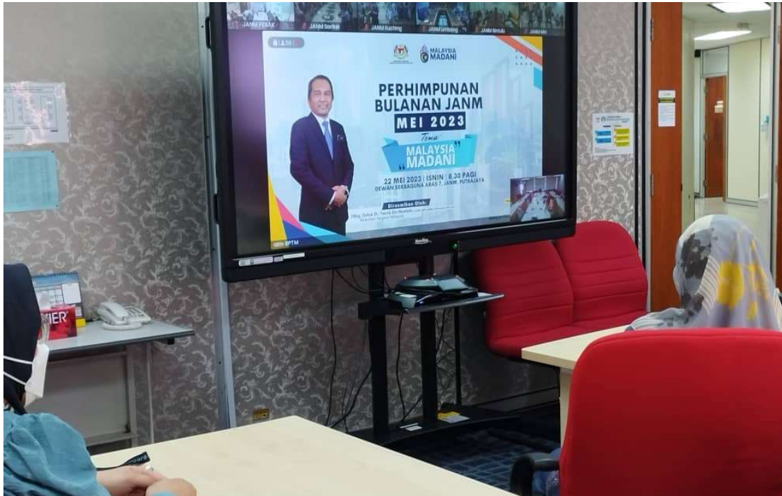
Mengikuti perhimpunan secara live streaming