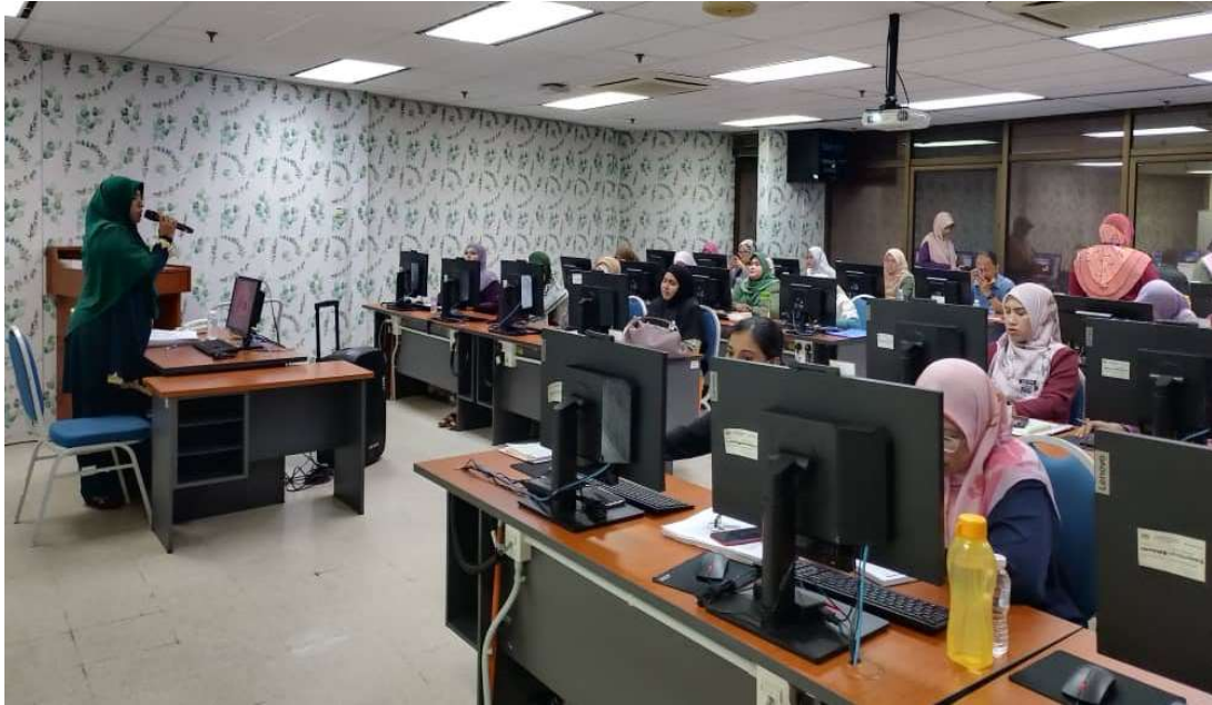
Para peserta yang terlibat