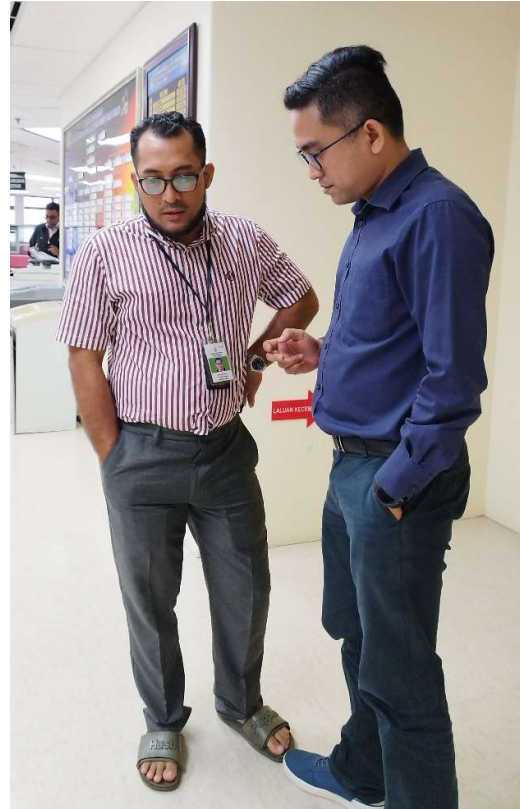
Aktiviti yang dijalankan