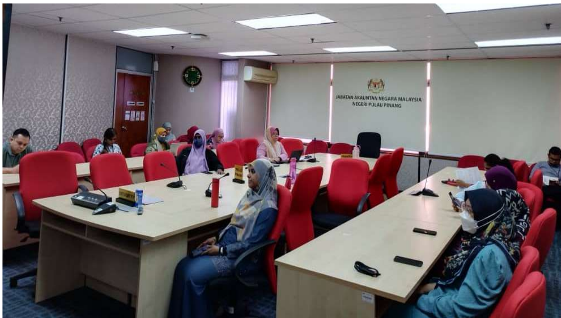
Warga JANMPP yang mengikuti secara live streaming di dalam Bilik Mesyuarat