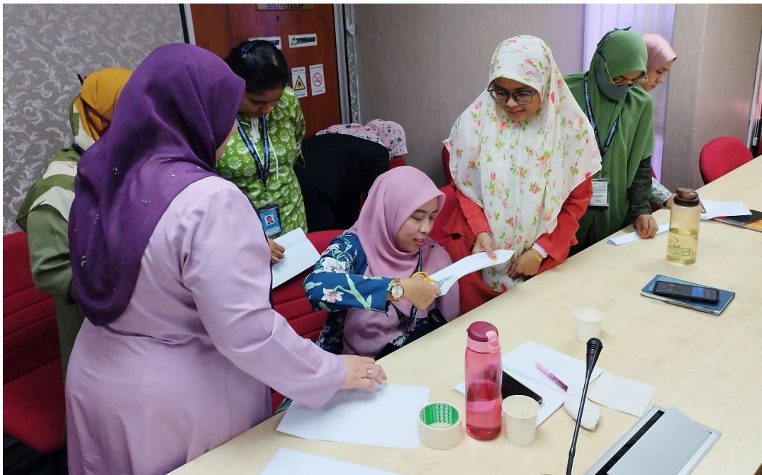
Aktiviti yang telah dijalankan