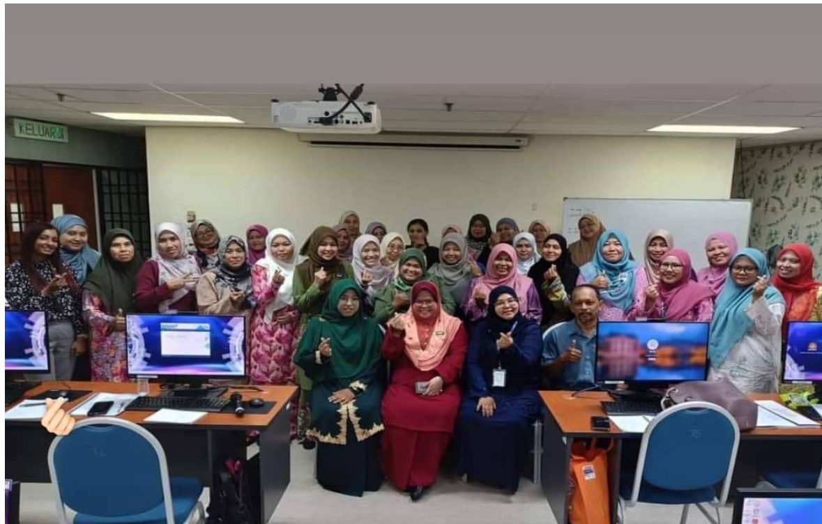
Para peserta bergambar kenangan