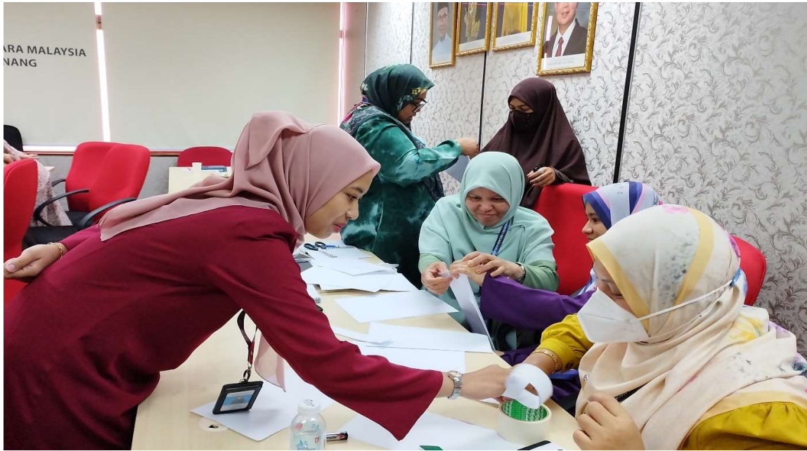
Aktiviti yang telah dijalankan