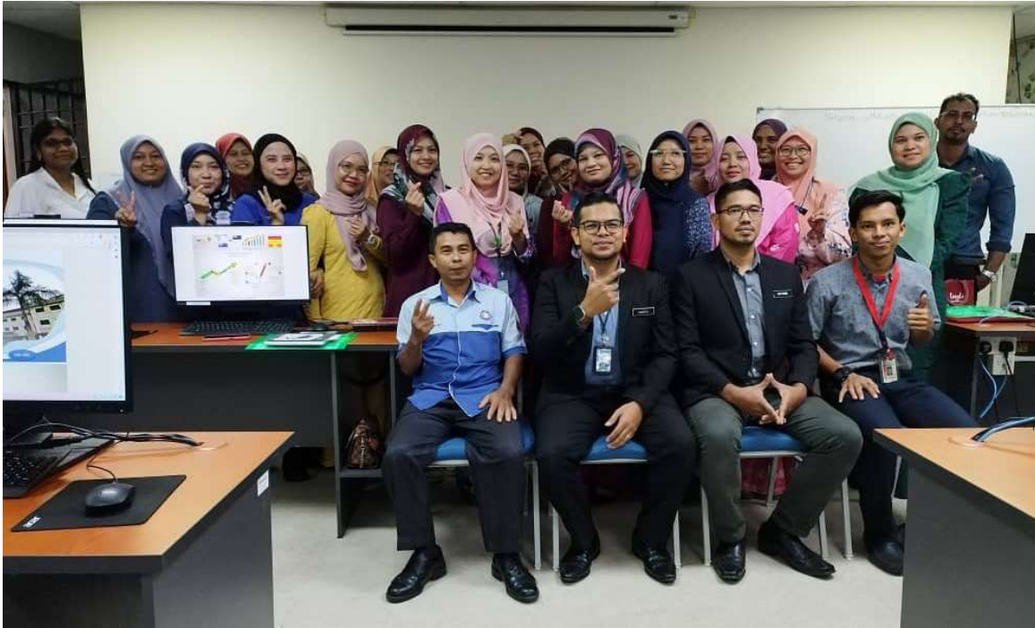
Peserta bergambar kenangan bersama penceramah