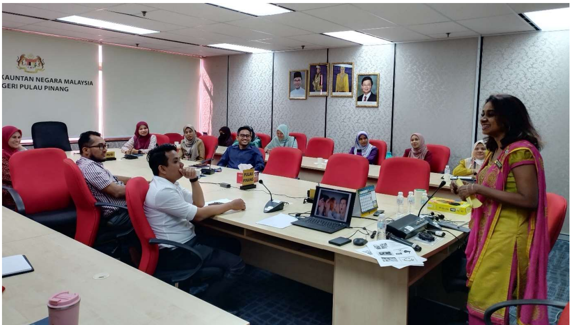
Para peserta yang terlibat

Kursus ini telah dihadiri seramai 28 peserta dari Jabatan Akauntan Negara Malaysia Negeri Pulau Pinang. Kursus ini telah disampaikan oleh Puan Punitha a/p Sivaraman dari Institut Tadbiran Awam Negara Kampus Wilayah Utara (INTURA). Objektif kursus adalah mempamerkan komunikasi berkesan secara verbal dan non- verbal, mempamerkan sikap positif dan layanan yang professional kepada pelanggan, menerangkan konsep perkhidmatan kaunter yang berkesan serta menyusun dan mengatur persekitaran kaunter yang mesra pelanggan.