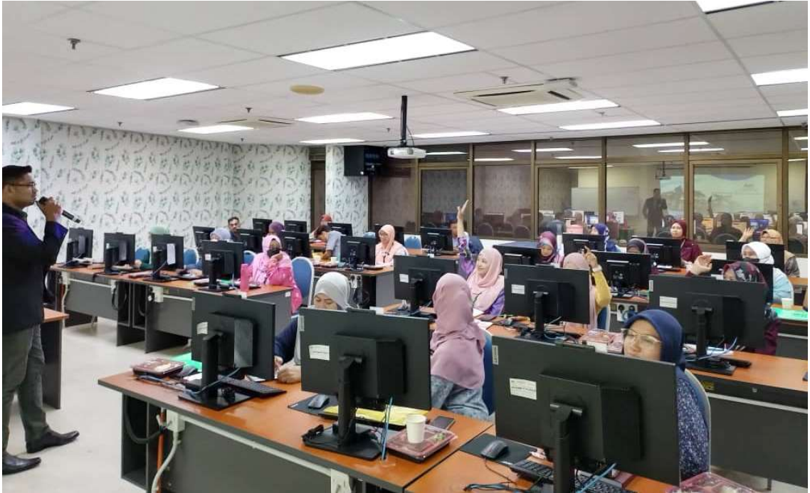
Peserta Kursus Pengurusan dan Perakaunan Aset