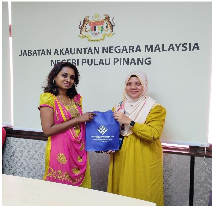
Cenderahati untuk penceramah