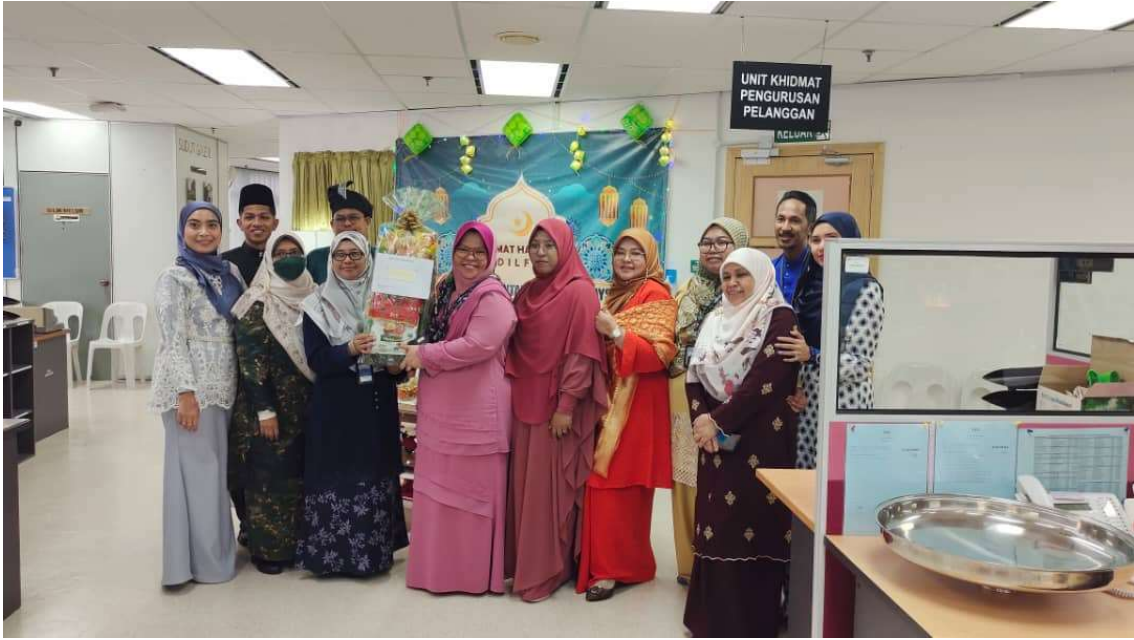
Pemenang gerai tercantik