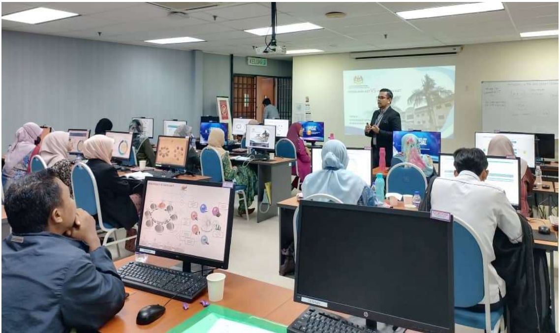
Peserta Kursus Pengurusan dan Perakaunan Aset