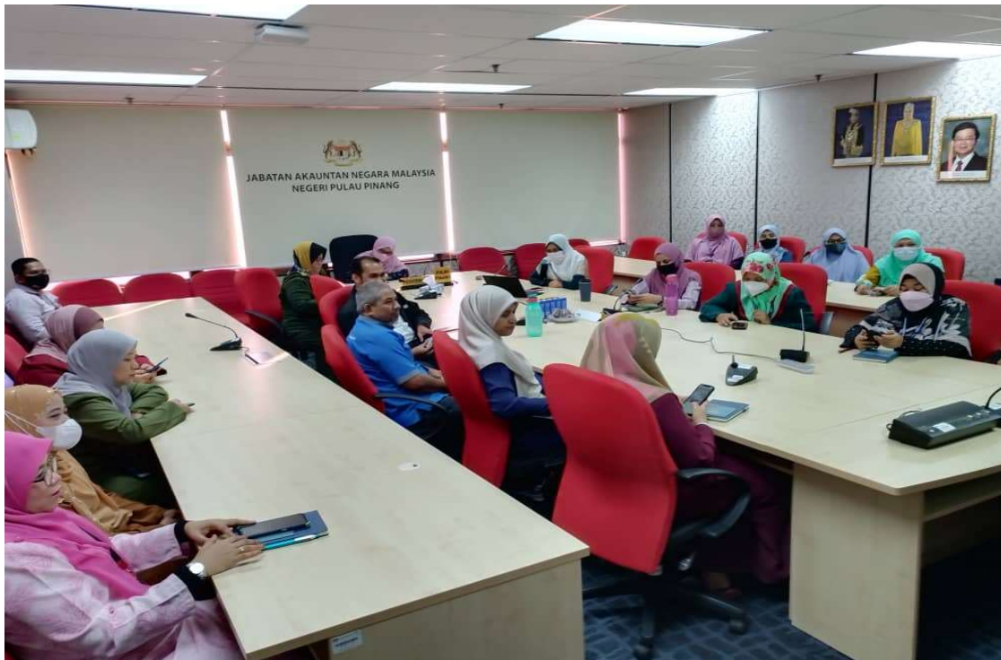
Sebahagian warga JANM Pulau Pinang di dalam Bilik Mesyuarat