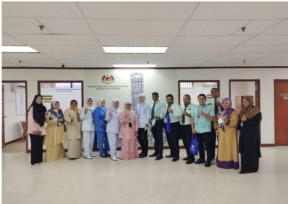
Bergambar bersama barisan Kementerian Kesihatan