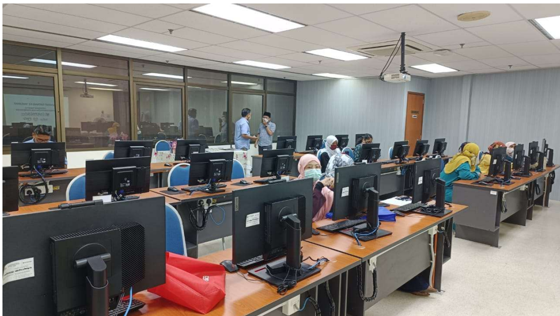
Sebahagian warga JANM Pulau Pinang