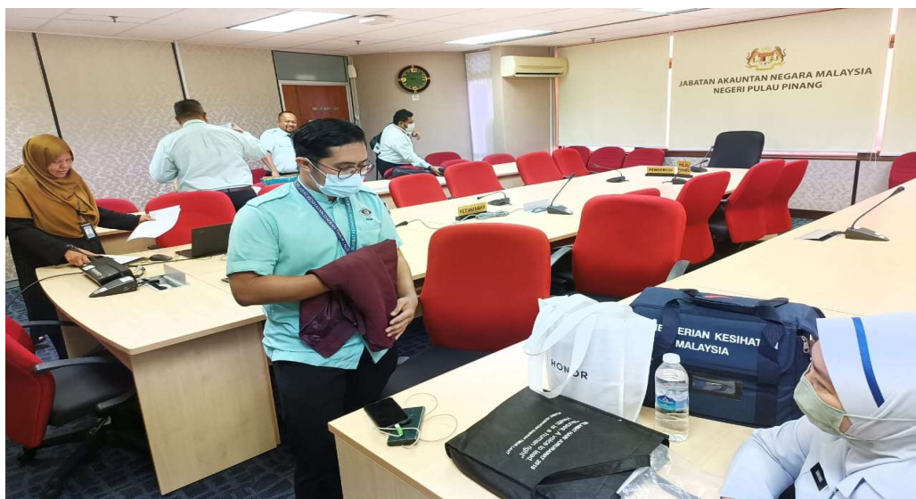
Pegawai Kesihatan yang terlibat