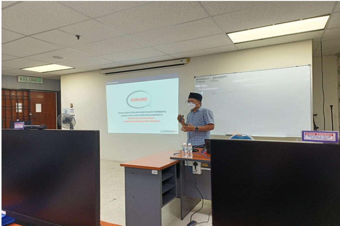
Pegawai dari Cuepacs yang menyampaikan taklimat