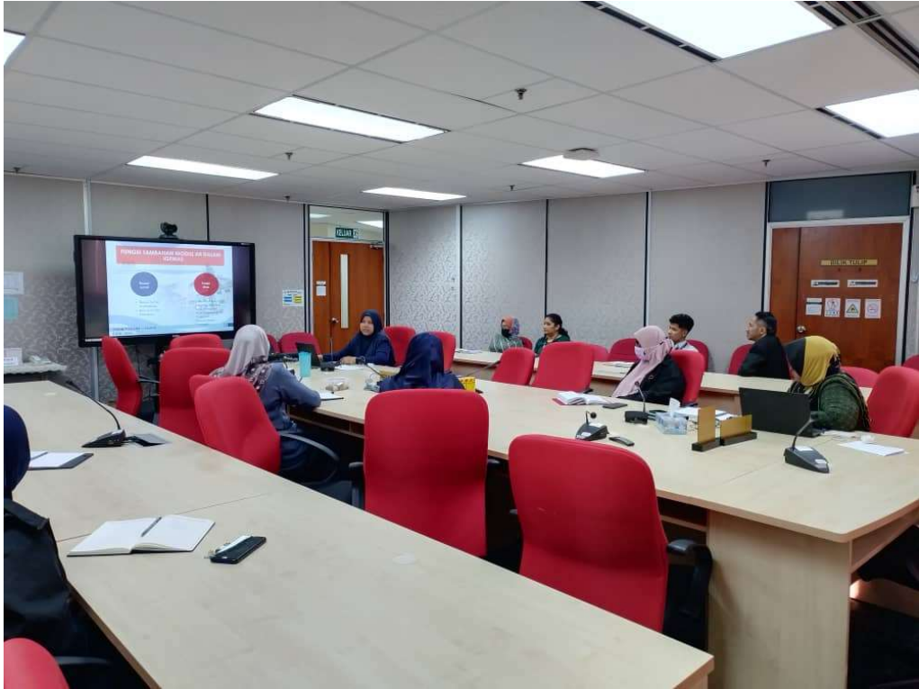
Gambar para peserta yang terlibat