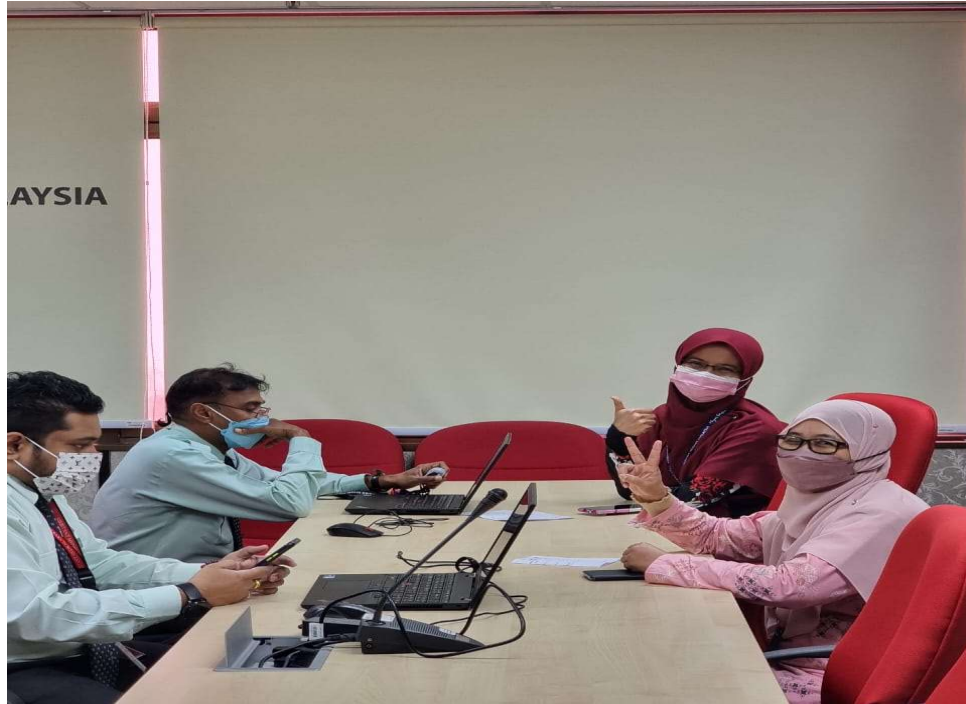
Pengarah dan Timbalan Pengarah menjalankan pemeriksaan kesihatan