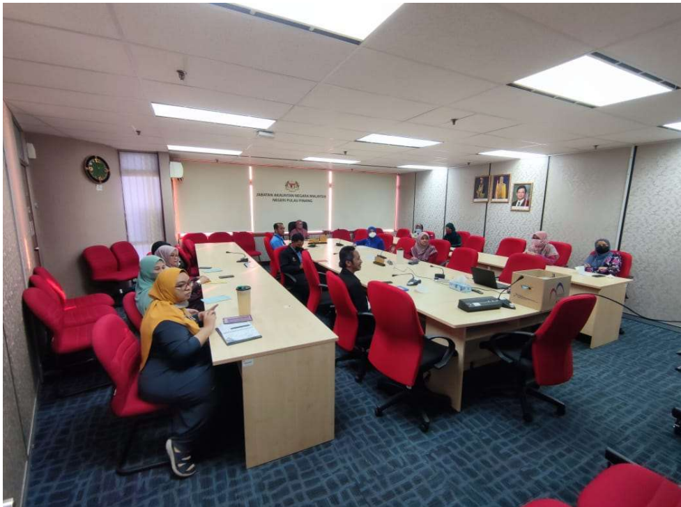
Sebahagian warga JANMPP di dalam Bilik Mesyuarat