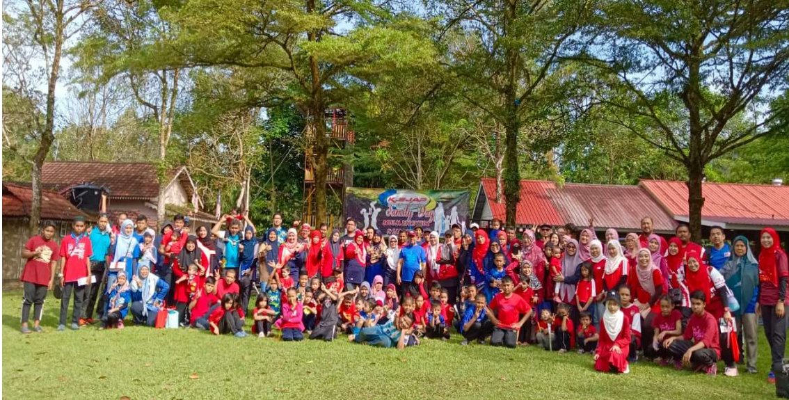
Sebahagian warga JANM Pulau Pinang bersama ahli keluarga

Kelab Jabatan Akauntan Negara Malaysia Pulau Pinang (KEJAP) telah menganjurkan Program Tautan Kasih pada 14 Januari 2023 bertempat di Sedim Riverside, Kedah bermula jam 9.00 pagi hingga 6.00 petang yang telah dihadiri seramai 184 orang termasuk ahli keluarga KEJAP. Program ini bertujuan untuk suai kenal dan mengeratkan silaturahmi sesama ahli keluarga KEJAP.