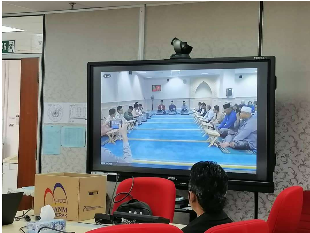
Melalui Live Streaming JANM