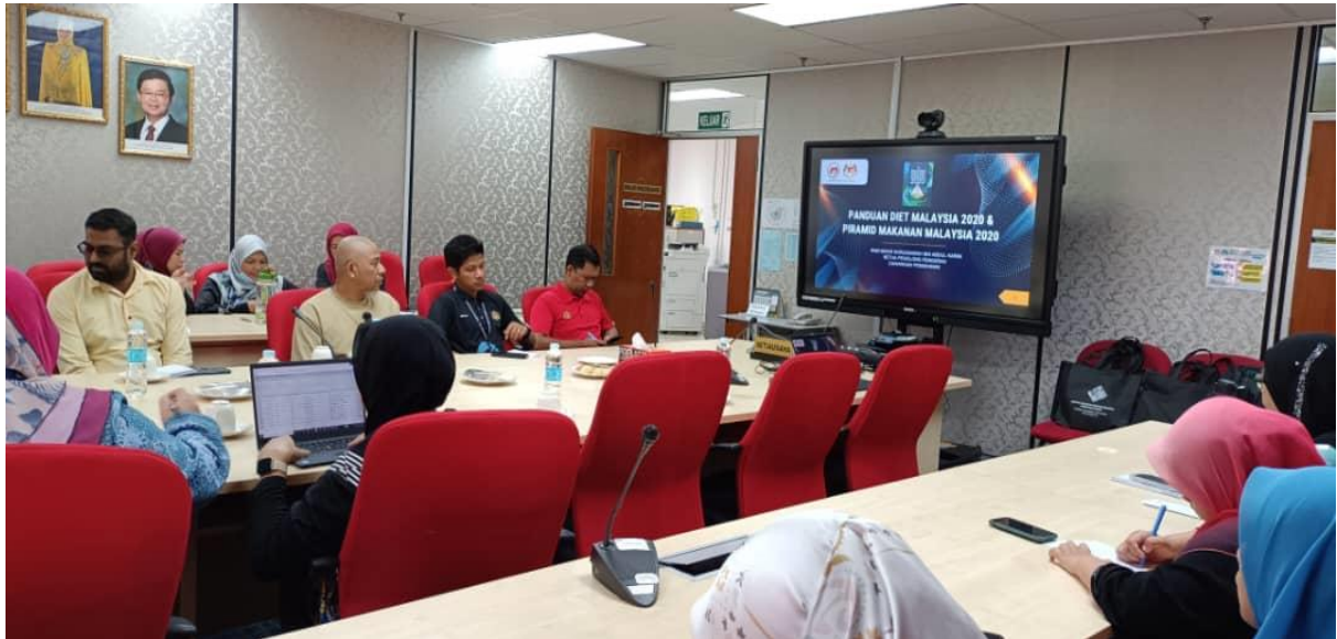
Taklimat Perkongsian mengenai Pemakanan Sihat