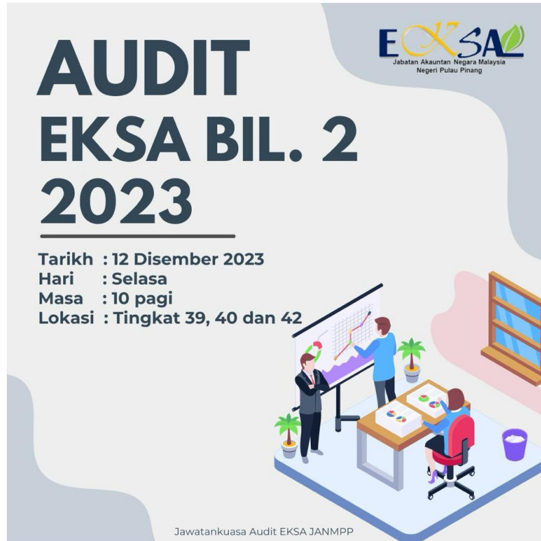
Hebahan Audit EKSA Bil. 2 Tahun 2023

Jawatankuasa Audit EKSA JANM Pulau Pinang telah menjalankan Audit Dalaman EKSA Bil. 2 Tahun 2023 pada 12.12.2023 di tingkat 39, 40 dan 42 JANM Pulau Pinang, KOMTAR. Audit Dalaman EKSA ini bertujuan bagi memastikan persekitaran bersih, kemas, selamat dan ruang kerja yang ceria dapat terus diamalkan dan dikekalkan oleh warga JANMPP.