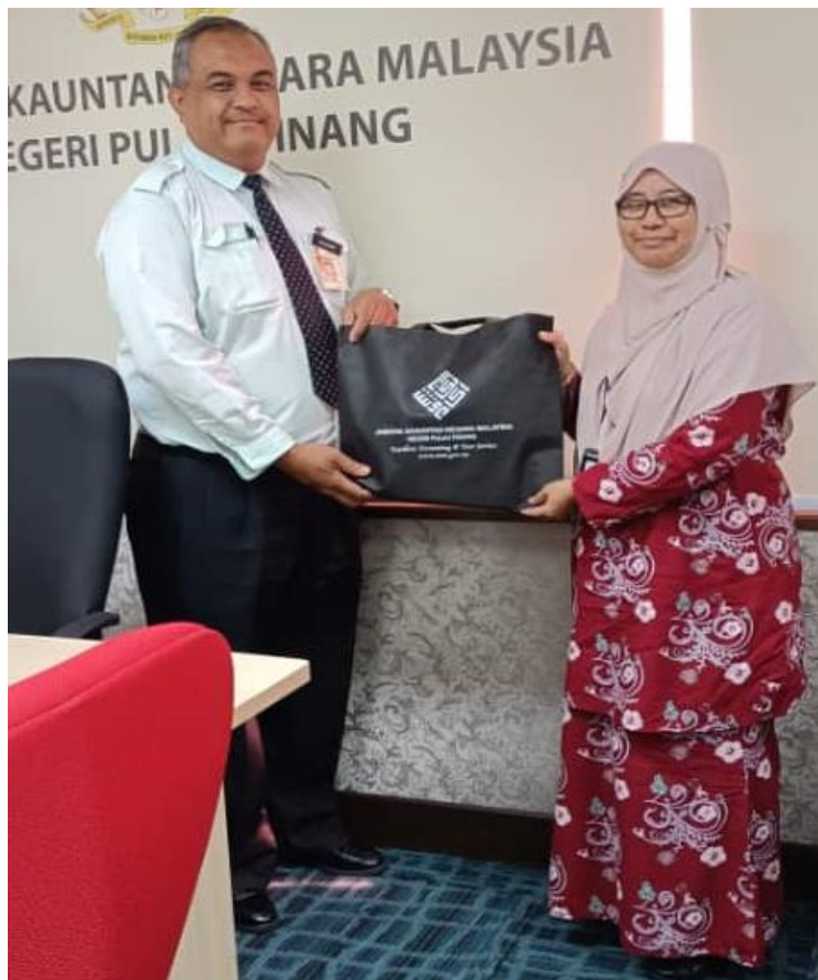
Penyampaian cendera hati