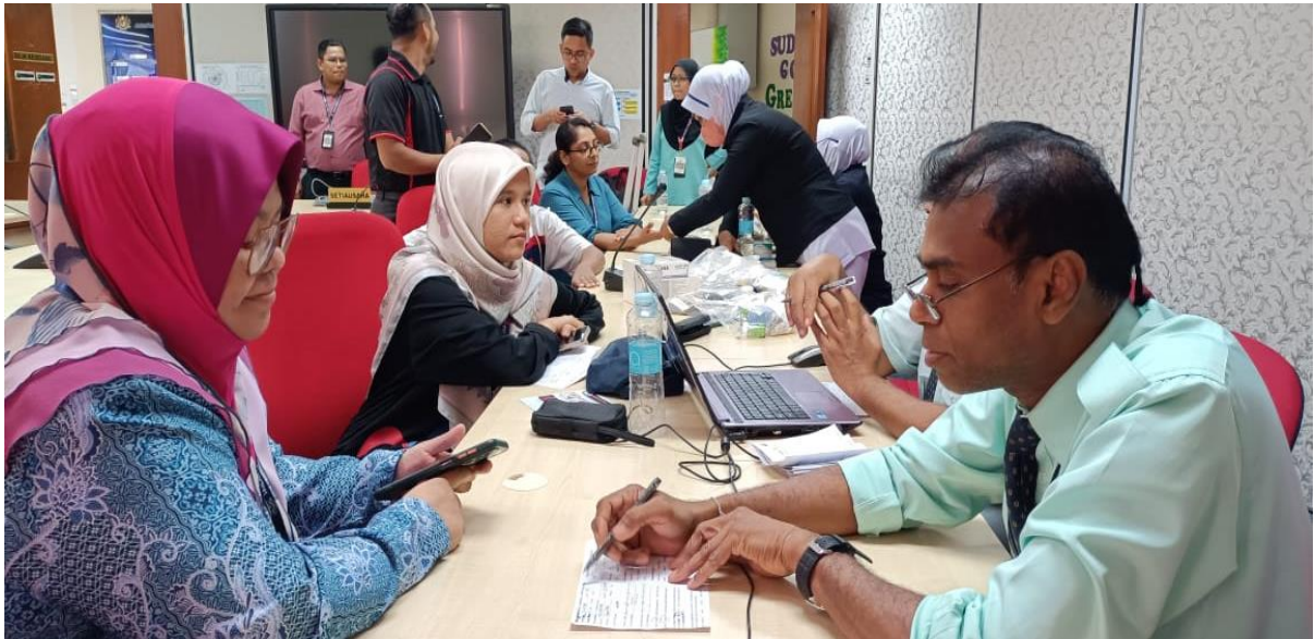
Sesi Konsultasi Saringan Kesihatan