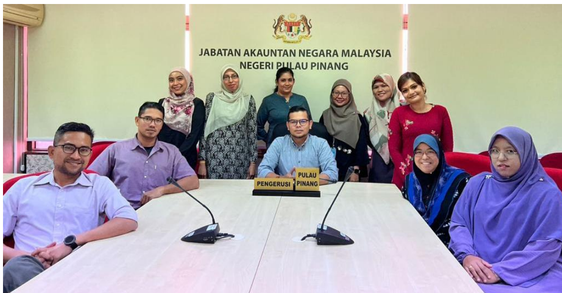
Jawatankuasa Audit EKSA JANMPP