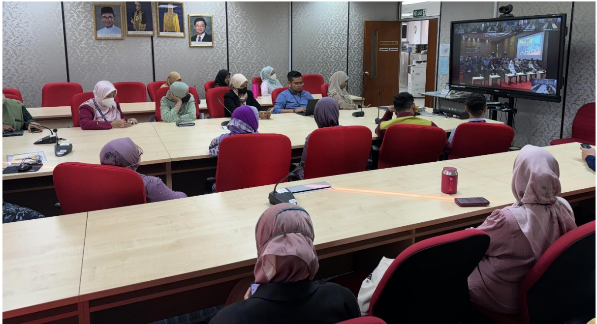
Gambar-gambar semasa Perhimpunan berlangsung :