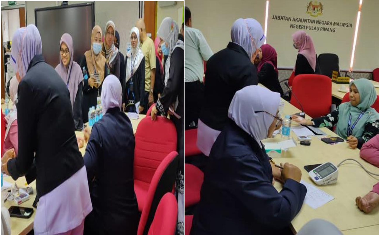
Ujian Saringan Kesihatan