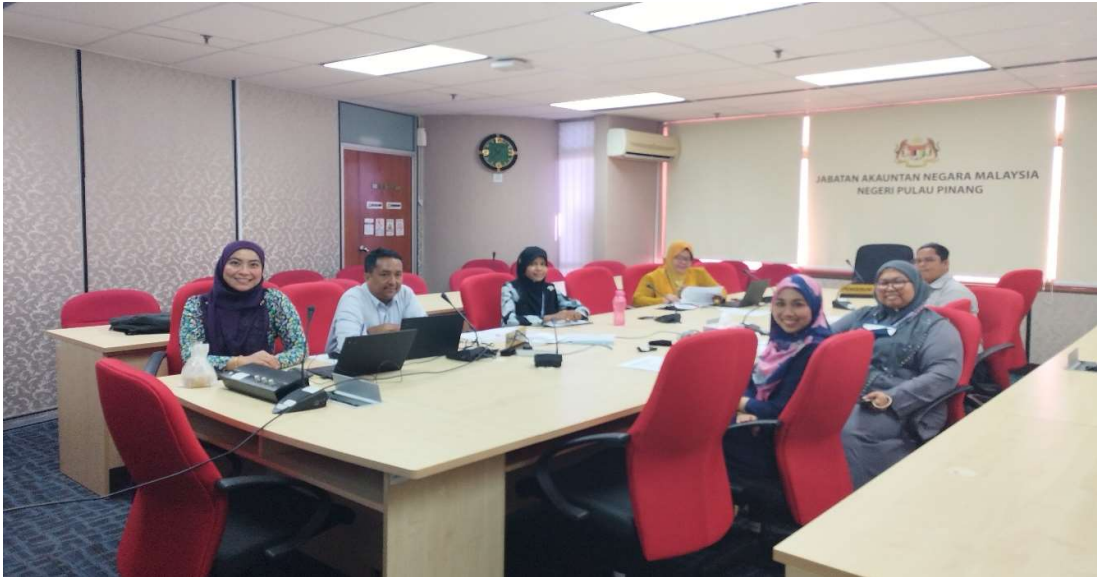
Peserta dari Unit Akaun

Unit Pengurusan Prestasi JANM Pulau Pinang telah menganjurkan Bengkel Pemurnian Senarai Tugas Unit Akaun pada 21 Februari 2023 dari jam 8.30 pagi hingga 4.30 petang. Bengkel ini telah dijalankan secara bersemuka di Bilik Mesyuarat, Tingkat 42 JANM Pulau Pinang. Seramai 7 orang pegawai dari Unit Akaun telah menghadiri bengkel ini.