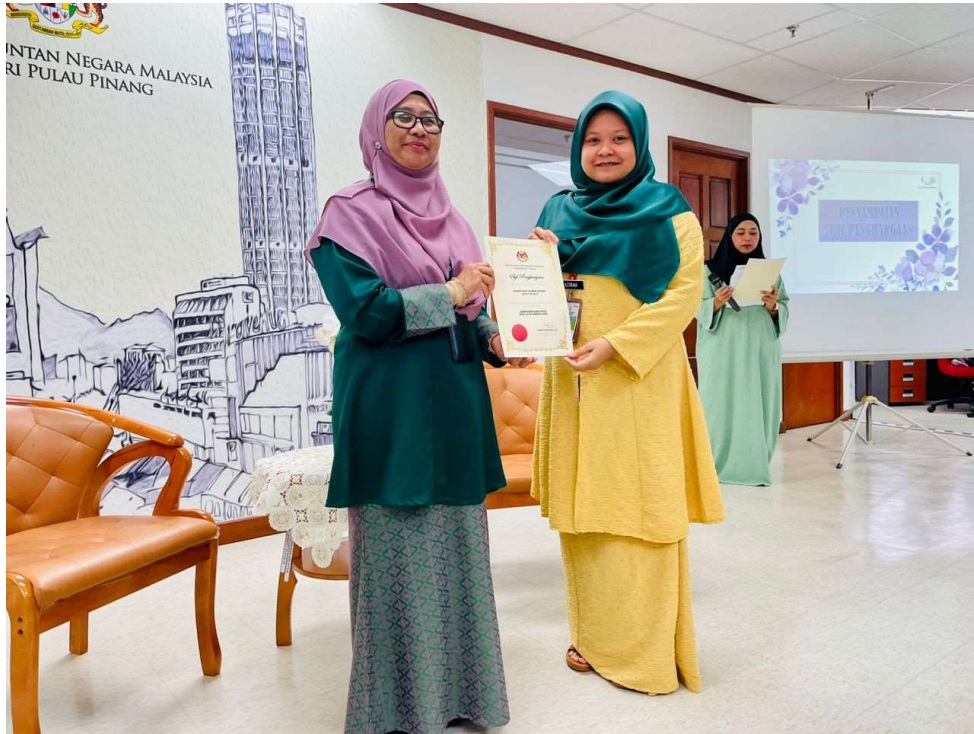
Penganugerah sijil kepada PIC EKSA