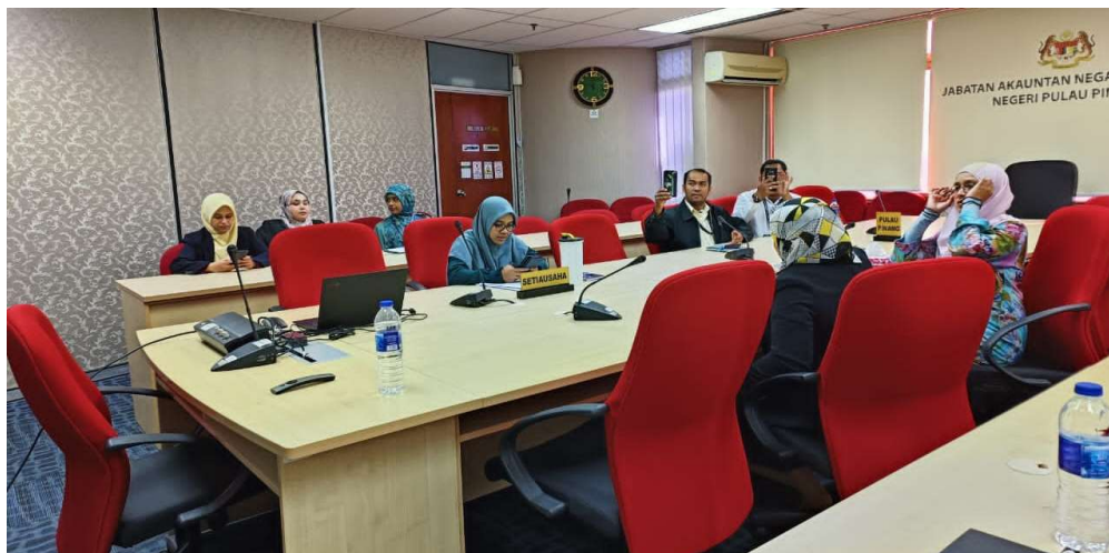
Sebahagian warga JANMPP yang berada di Bilik Mesyuarat