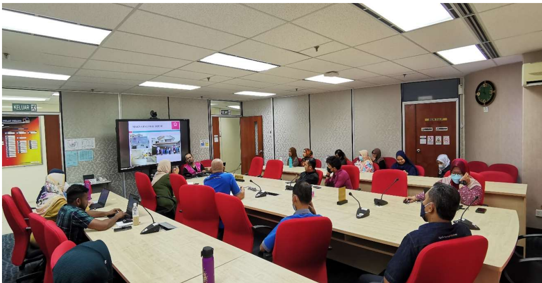
Sebahagian warga JANMPP yang berada di Bilik Mesyuarat