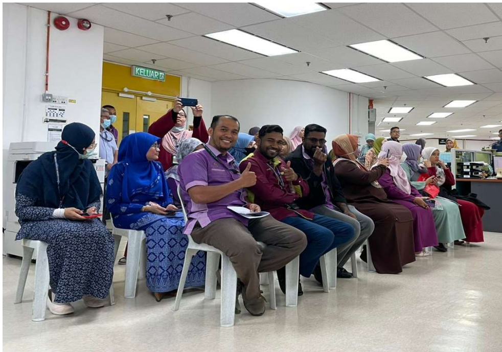
Sebahagian daripada warga JANMPP