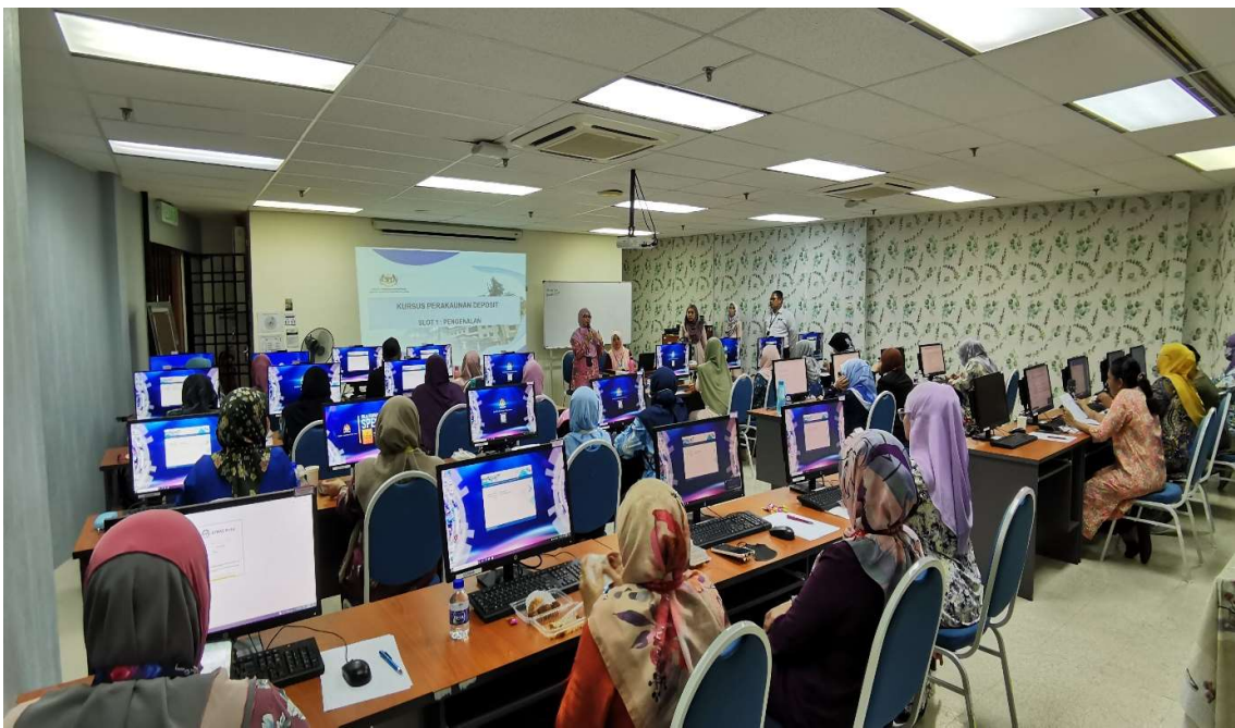
Para peserta dari pelbagai jabatan