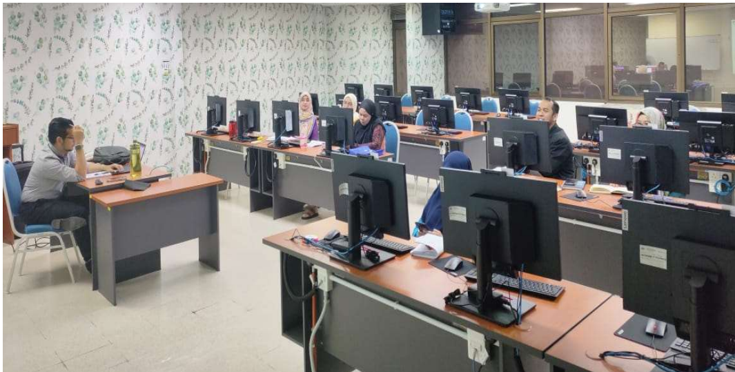
Peserta dari Unit Pengurusan Aset

Unit Pengurusan Prestasi JANM Pulau Pinang telah menganjurkan Bengkel Tatacara Perakaunan Aset Bukan Kewangan Kerajaan pada 21 Februari 2023 dari jam 8.30 pagi hingga 4.30 petang. Bengkel ini telah dijalankan secara bersemuka di Bilik Latihan, Tingkat 40 JANM Pulau Pinang. Seramai 8 orang pegawai dari Unit Pengurusan Aset telah menghadiri bengkel ini.