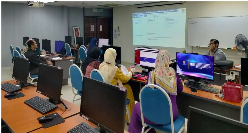
Peserta yang terlibat