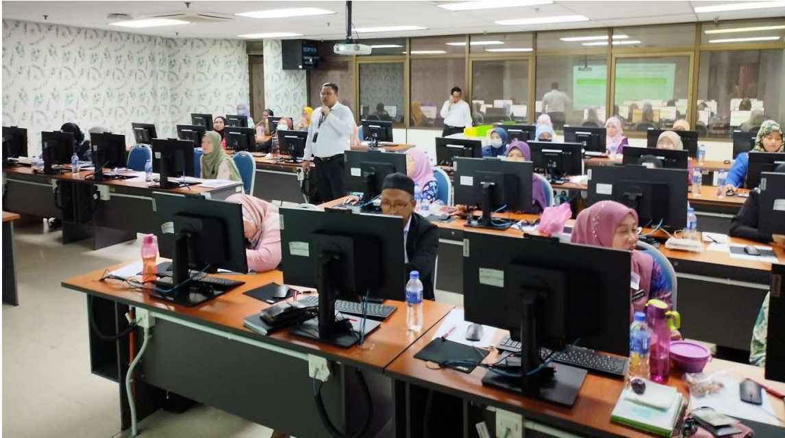
Para peserta Kursus Generik: Pengurusan Perakaunan Deposit