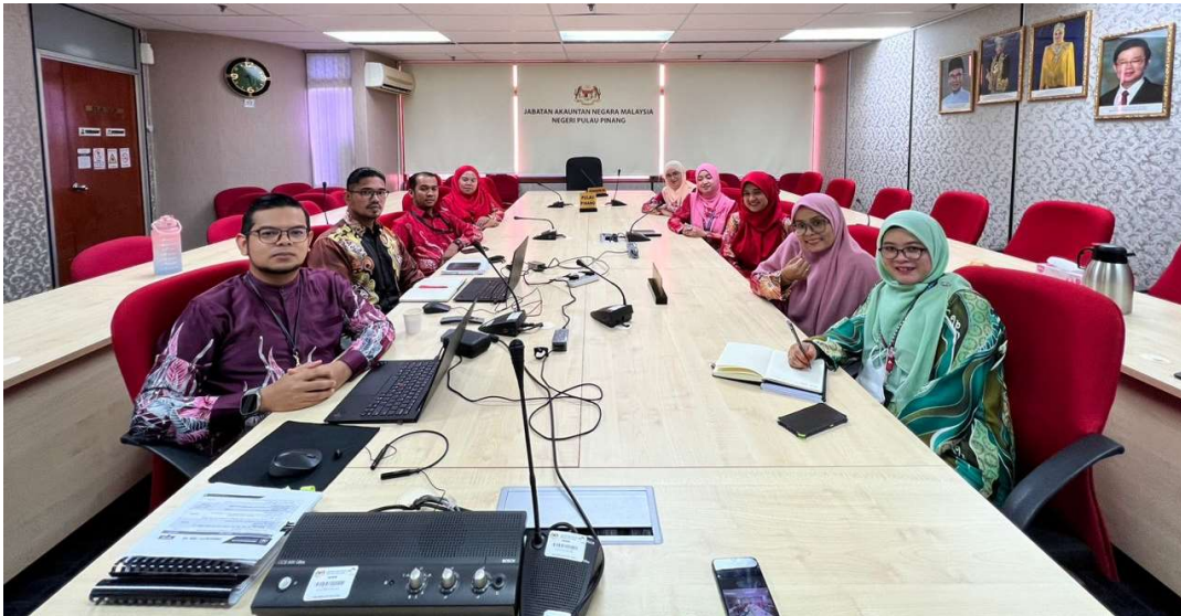
Para pegawai dari Unit Pengurusan Aset

Unit Pengurusan Aset JANM Pulau Pinang telah menganjurkan Taklimat Bengkel SPANM 3/2022 – Tatacara Perakunan Aset bukan Kewangan Kerajaan pada 23 Februari 2023 dari jam 9.30 pagi hingga 4.30 petang. Taklimat ini telah dijalankan secara atas talian. Seramai 187 orang peserta dari pelbagai PTJ telah menghadiri taklimat ini.