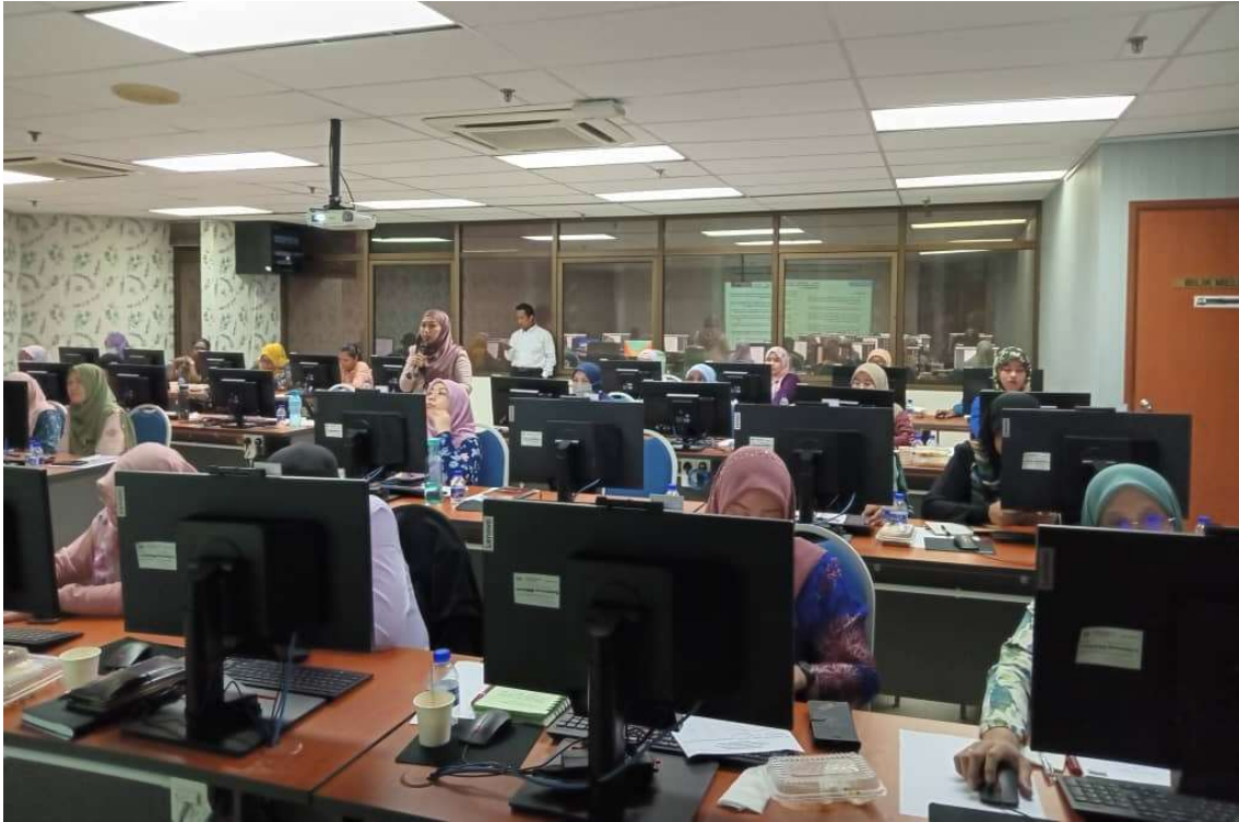
Para peserta yang terlibat.