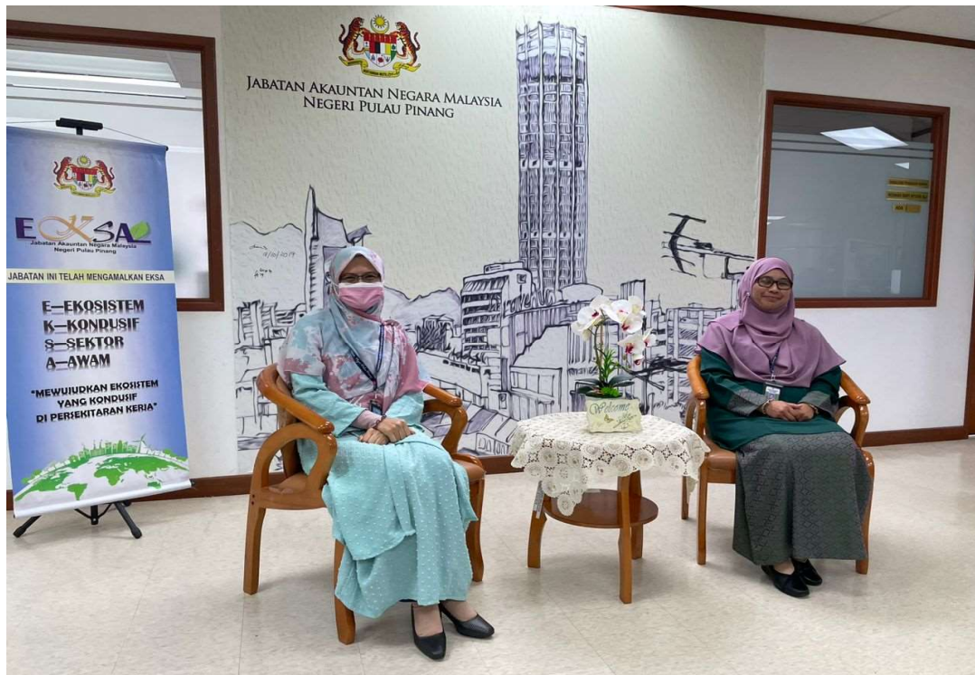
Pengarah JANM Pulau Pinang bersama Timbalan Pengarah

Majlis ini juga telah diselitkan dengan pentauliahan AJK baharu EKSA bagi sesi 2023-2025.