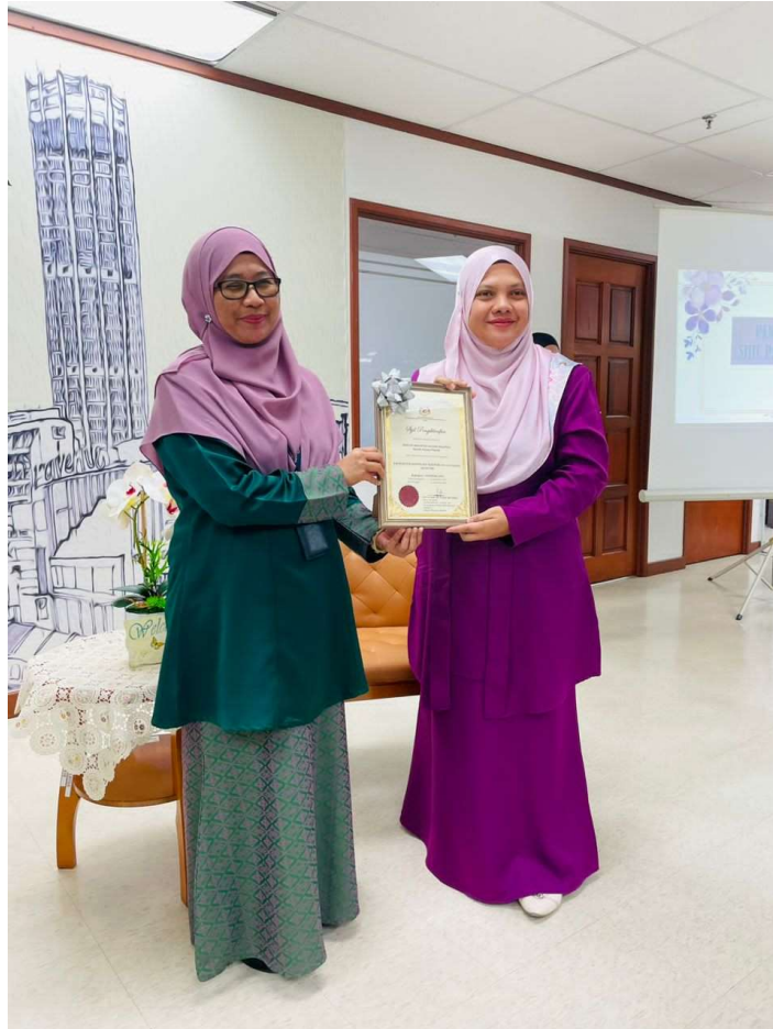
Sijil Penganugerahan kepada AJK EKSA 2019-2022