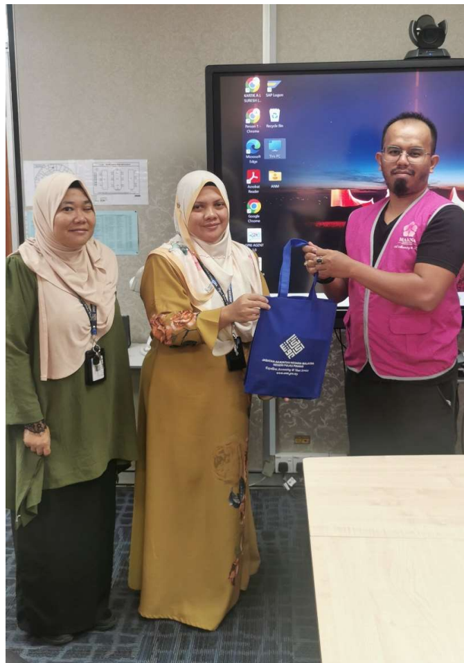
Cenderahati dari JANMPP kepada Pegawai MAKNA