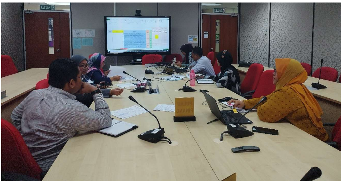
Peserta yang terlibat