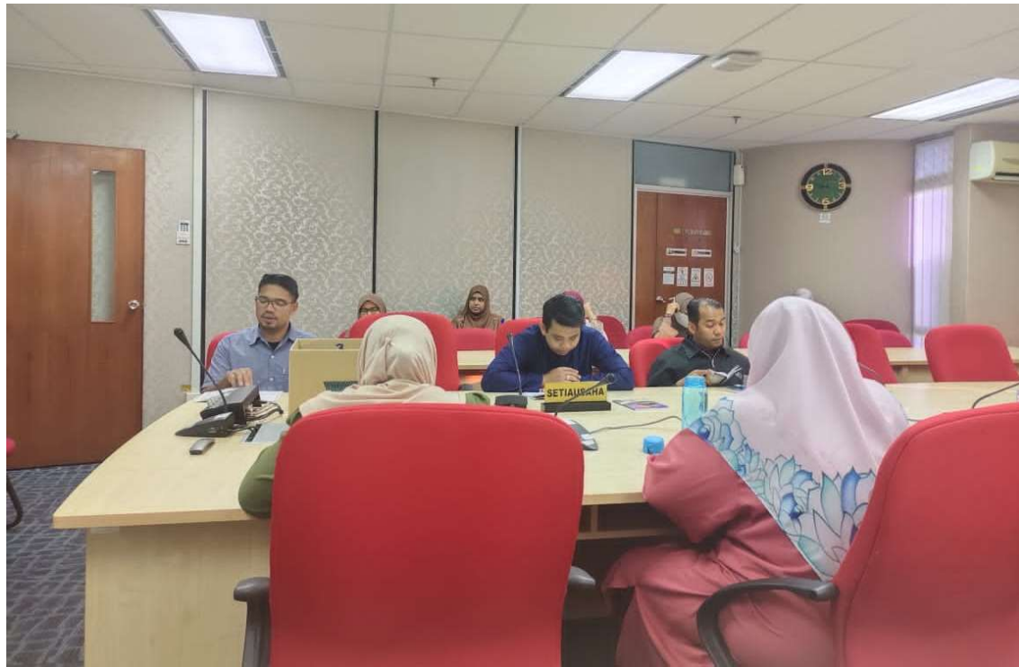
Sebahagian warga JANMPP di Bilik Mesyuarat