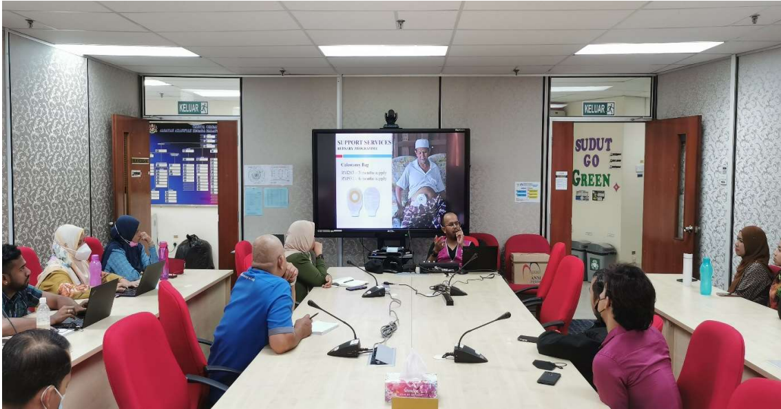
Kempen Kesedaran Kanser yang disampaikan oleh pegawai MAKNA