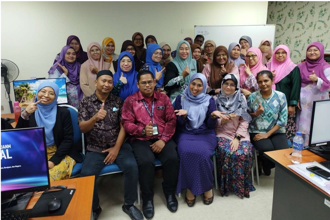
Para peserta bergambar kenangan bersama Penceramah Kursus