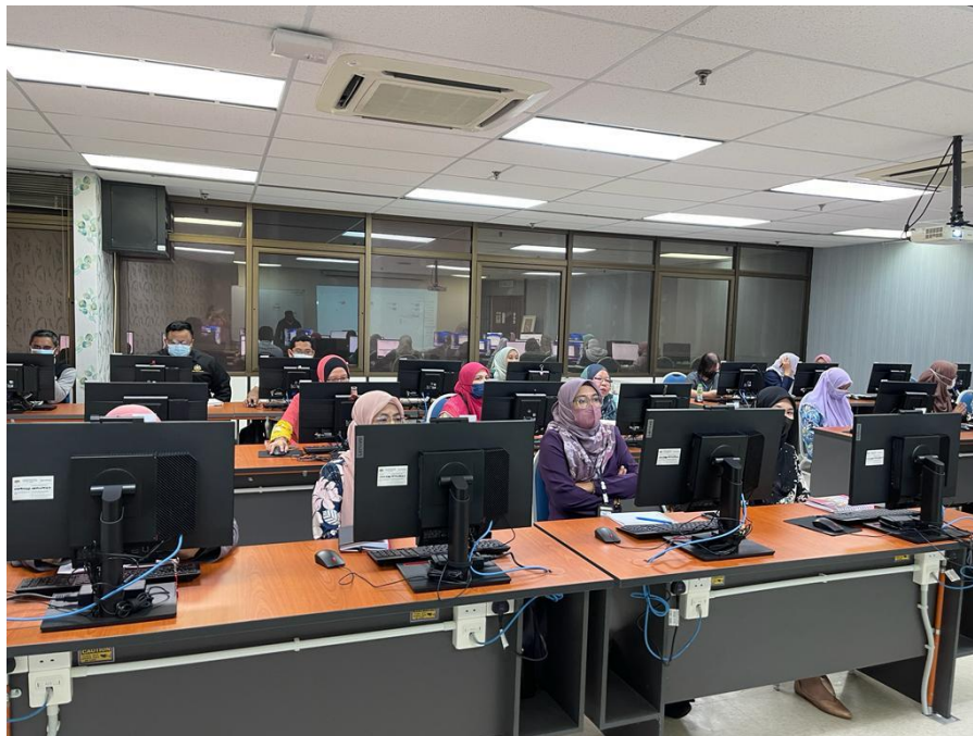
Antara Wakil dari PTJ yang terlibat dalam taklimat