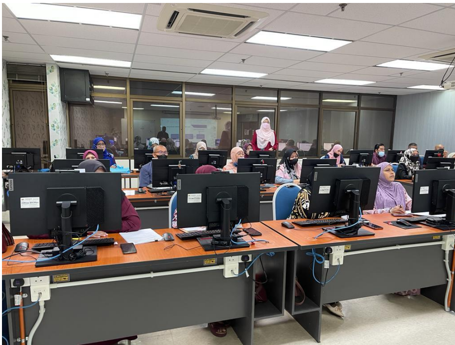
Antara Wakil dari PTJ yang terlibat dalam taklimat