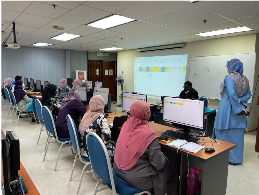
Penyampaian ceramah kepada PTJ di Pulau Pinang