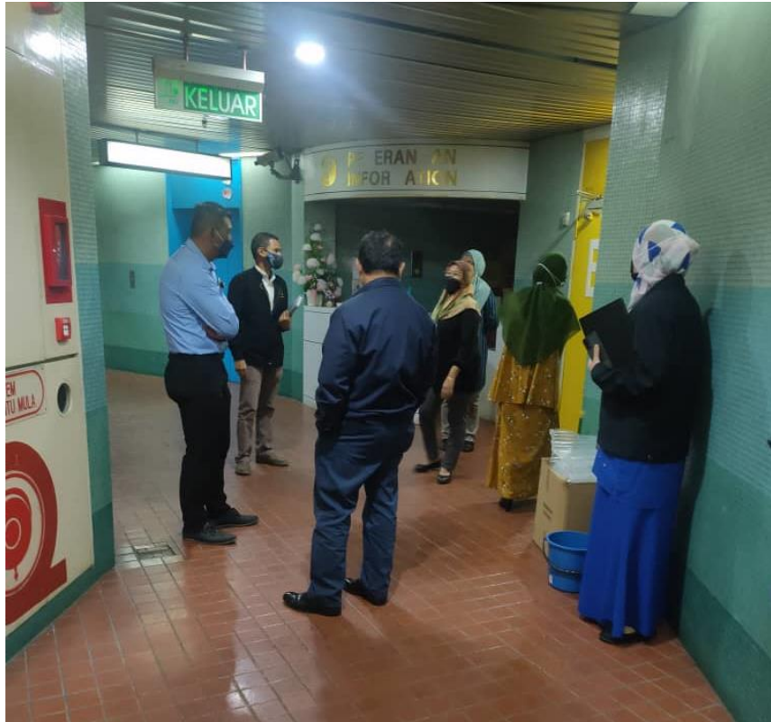
Lawatan di Pintu Masuk Pegawai JANMPP