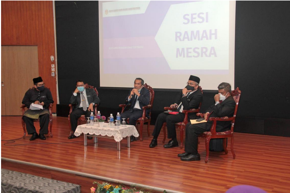
Sesi Ramah Mesra