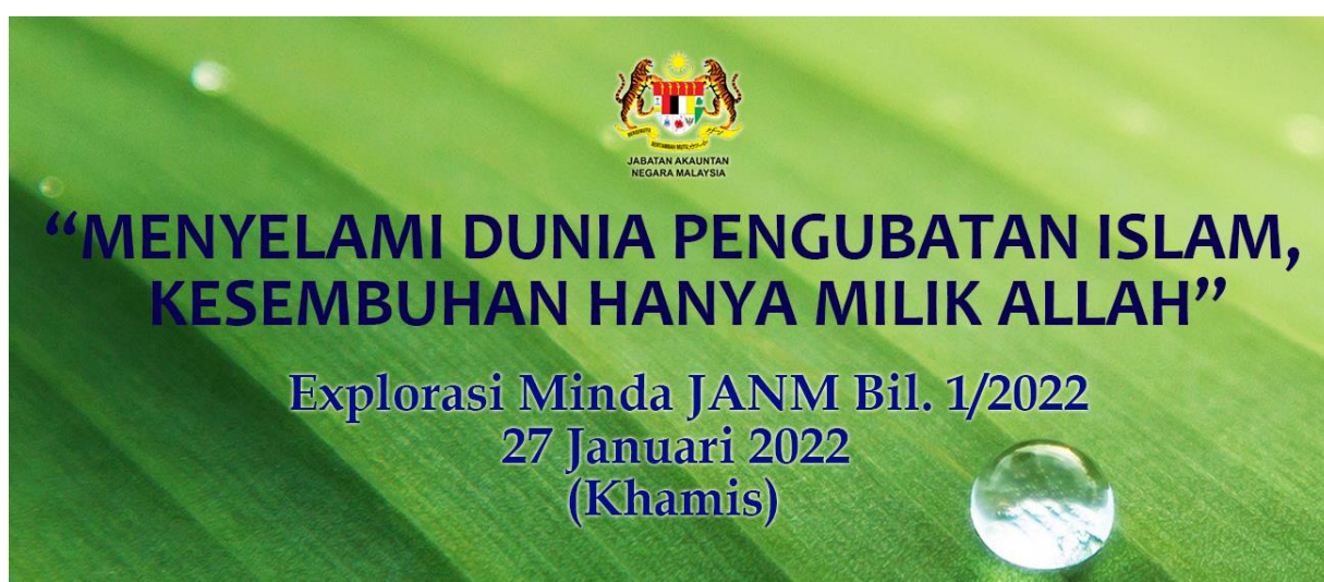
Poster Hebahan Kursus

Bahagian Pembangunan Perakaunan dan Pengurusan (BPPP) Jabatan Akauntan Negara Malaysia telah menganjurkan kursus Eksplorasi Minda – Pengubatan Islam ‘Menyelami Dunia Pengubatan Islam, Kesembuhan Hanya Milik Allah’ Bil 1/2022 secara atas talian pada 27 Januari 2022 dari jam 8.30 pagi hingga 4.30 petang. Seramai 37 orang peserta menghadiri kursus dari tempat masing-masing menggunakan pautan aplikasi Lifesize .