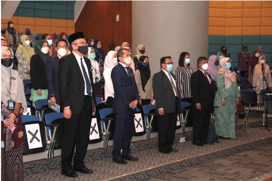
Nyanyian lagu Negaraku