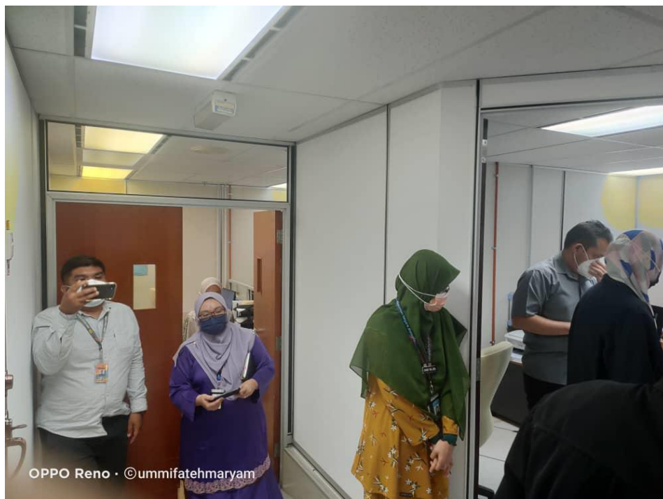
Lawatan Di Bilik Server JANMPP

Lawatan pemeriksaan ini telah diiringi oleh Pengarah, Timbalan Pengarah, Ketua Penolong Pengarah dan Pegerusi Jawatankuasa Keselamatan JANM Pulau Pinang. Lawatan ini telah diadakan pada 25 Januari 2022 dari pukul 9.30 pagi hingga 11.30 pagi.