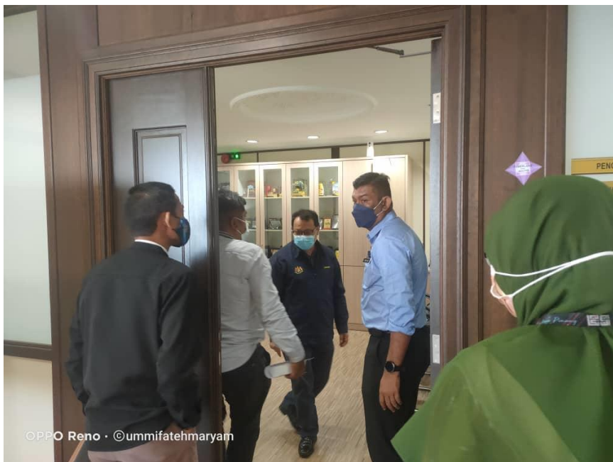
Lawatan dan di Bilik Pengarah JANMPP