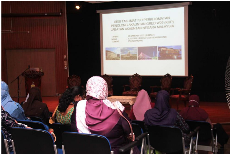
Sebahagian peserta yang terlibat