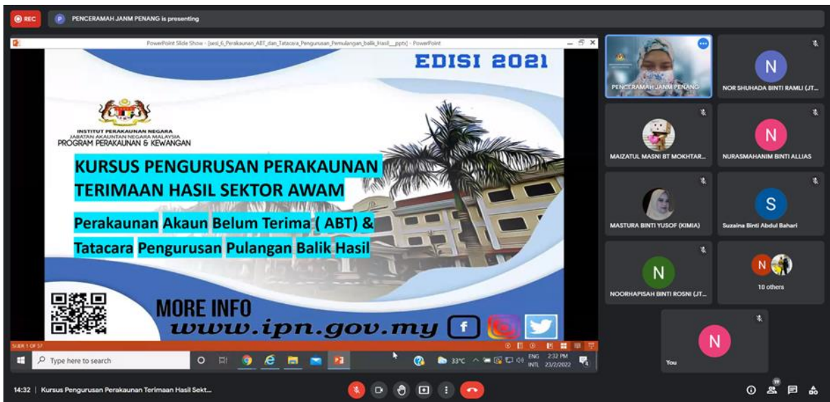
Penceramah memberi ceramah secara atas talian