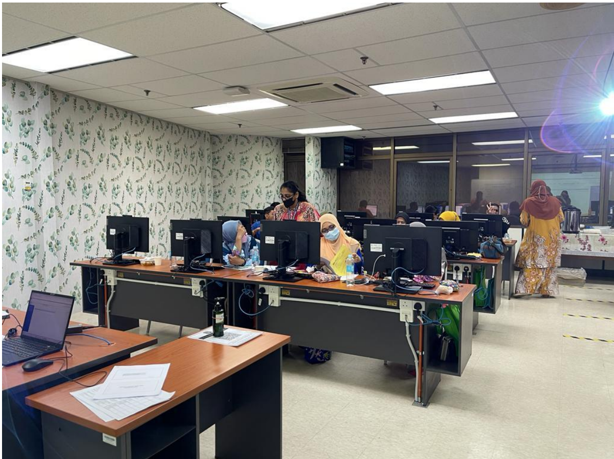
Sebahagian peserta yang terlibat