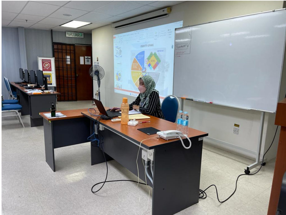
Penceramah menyampaikan taklimat