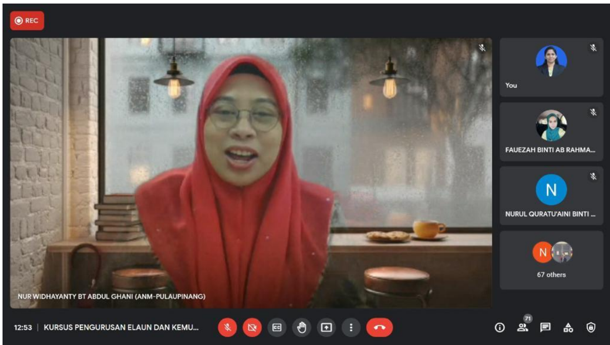
Penceramah yang memberi taklimat