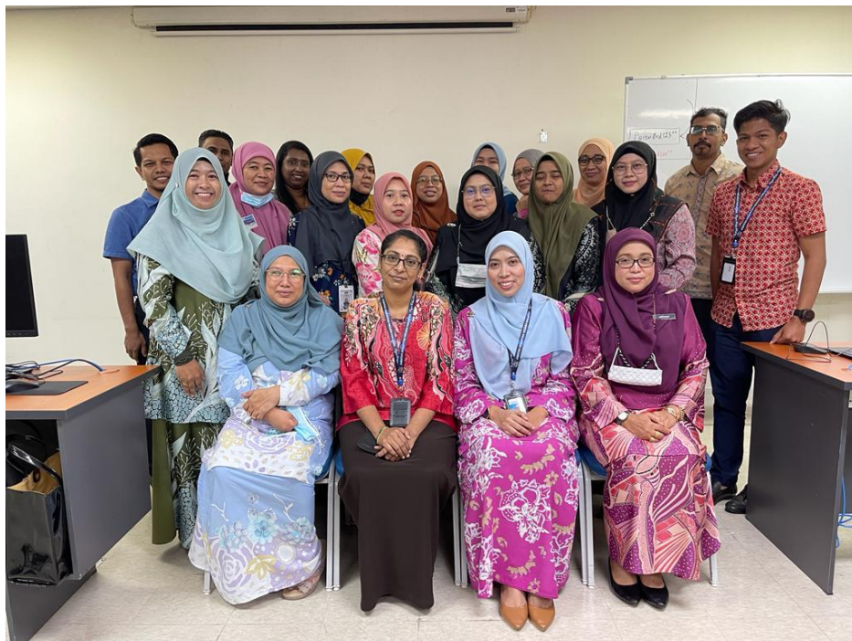
Gambar peserta dan penceramah secara berkumpulan