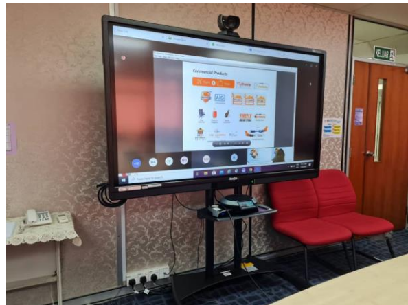
Peserta dari Bilik Mesyuarat JANM Pulau Pinang dan Penceramah secara di atas talian