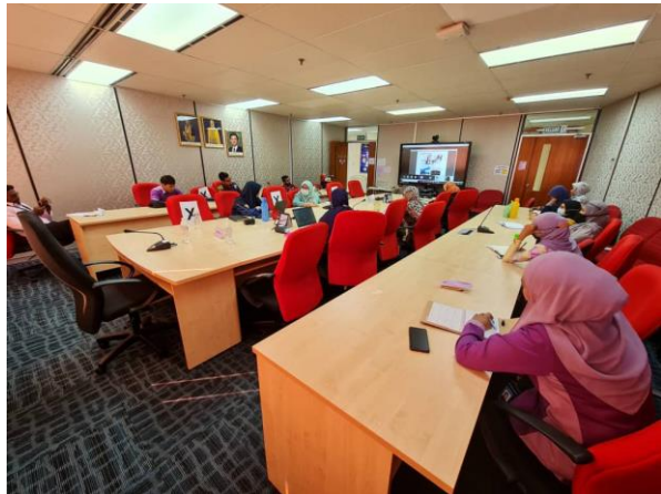
Peserta dari Bilik Mesyuarat JANM Pulau Pinang