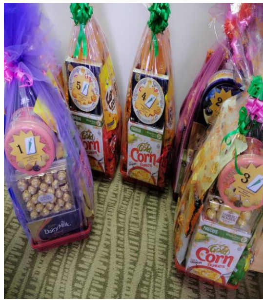
PERSEMBAHAN CIPTAAN DAN HADIAH